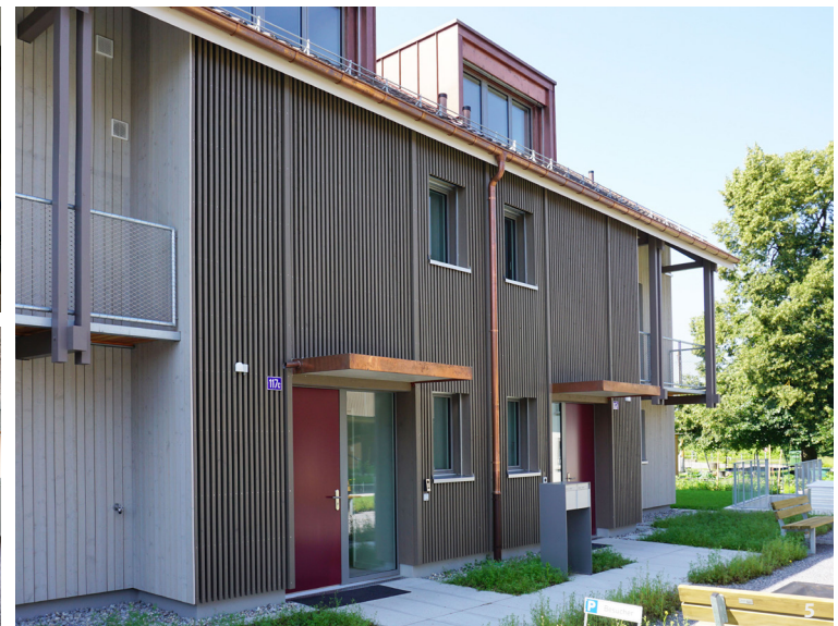
Titelbild: Blick von Südwest